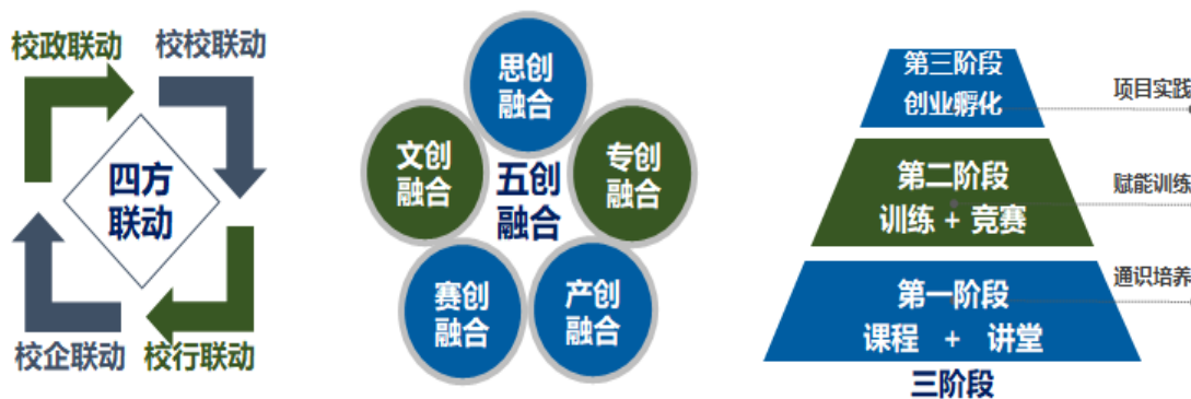
图1乡村振兴视域下“四方联动、五创融合、三阶递进”创新创业人才培养模式

福建农业职业技术学院经济管理学院开设市场营销、现代物流管理、连锁经营与管理等专业，已培养学生 11000 多人。为贯彻落实国家职业教育改革实施方案，提升学生创新创业素养与能力，助力乡村振兴，针对创新创业人才培养中存在的人才培养主体结构单一、人才培养路径维度欠缺、人才实践技能较弱、创新能力不强等问题，经管学院扎实推进校企合作、产教融合、协同育人，反复探索与实践乡村振兴视域下“四方联动、五创融合、三阶递进”的创新创业人才培养模式。