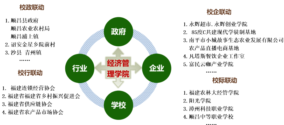
图2 四方联动共育创新创业人才

一是校政联动。与顺昌县签订合作框架协议，成立乡村振兴研究院；与顺昌县、诏安县、沙县等农业农村局成立科技工作站，在人才培养、乡村振兴、科技服务等方面搭建合作育人平台。